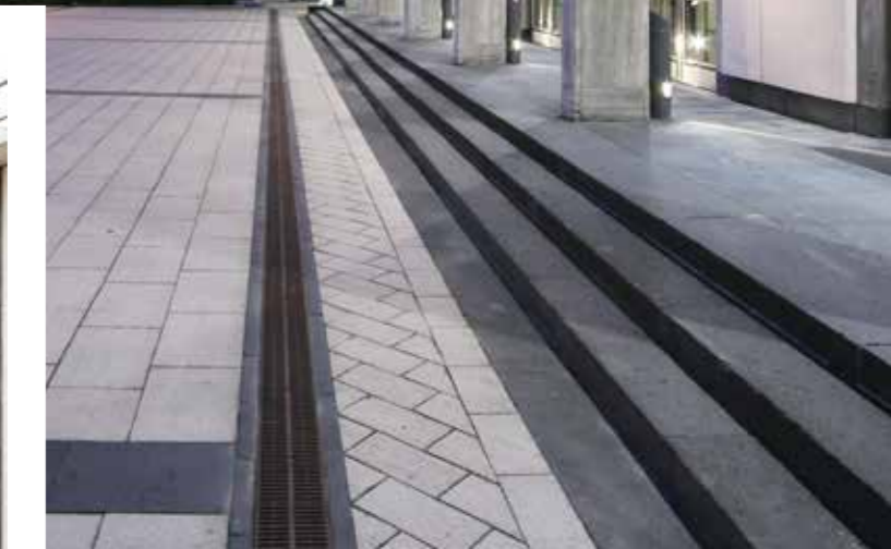
Links oben: Von der Grundsteinlegung bis zur Richtfest-Feier - Arbeit ist Beteiligung am Werk Links unten: Dialog mit dem Zielpublikum - Fachmesse EXPO REAL München Rechts: Philharmonie und Saalbau Essen nach Sanierung und Umbau